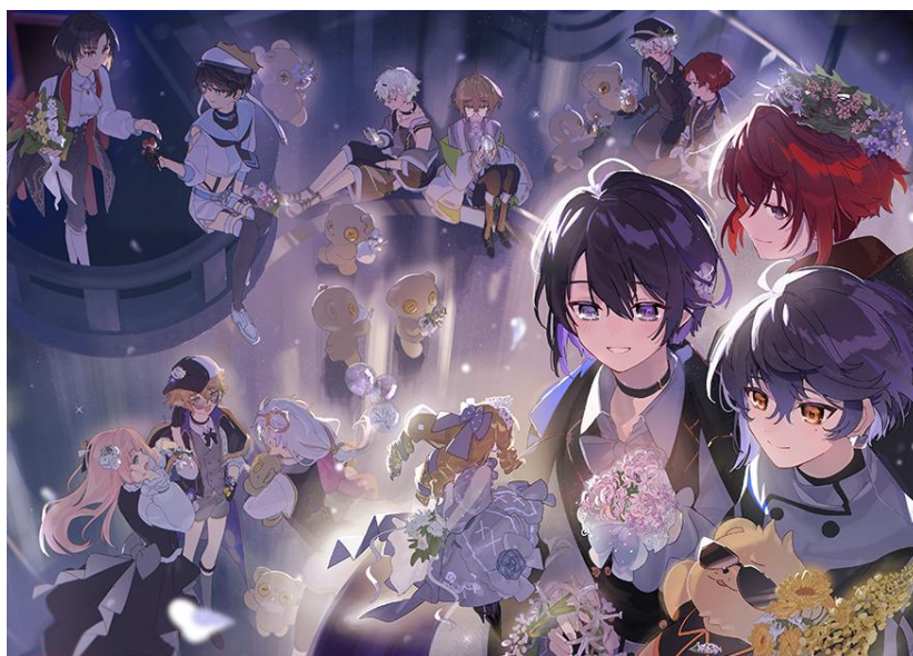
大賞 「カーテンコールの贈り物」(作：さびえんす)

「プレゼントをもらった時の笑顔」をテーマに描かれた各作品は、クロケスタという作品や登場人物への想いを感じ取ることができる素敵なものばかりです。