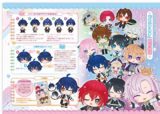
4 周年記念冊子「CLOQUESTA ～4th Anniversary BOOK～」