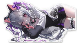
© NEOWIZ & GAMFS N inc. All rights reserved.