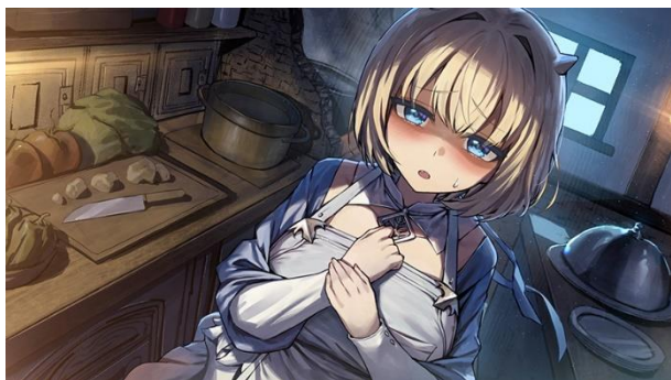
「ユースティア」 イラスト：ねしあ

4 人のヒロインたちと「もしも結婚したら？」というドキドキ、ラブラブ、夢がふくらむテーマのもとに描かれたイラストをグッズの形にしてお手元にお届けします。たっぷりとご堪能ください。