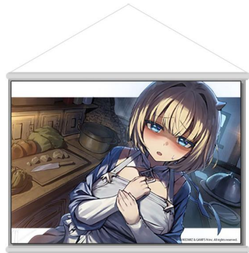
B2 タペストリー 各 4,180 円(税込み) 全 4 種