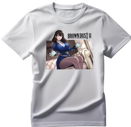
Tシャツ 各 3,960 円(税込み) 全 4 種